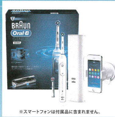
※スマートフォンは付属品に含まれません。

ブラウンオーラル B 歯ブラシが丸型で回転するタイプのもの。普通の歯ブラシでは届きにくい口蓋側・舌側によく毛先が届くのが特徴。大きさや振動がやや大きい。