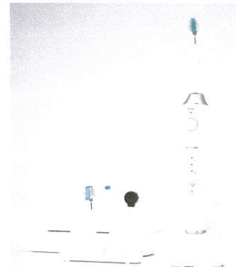
本体寸法 約高さ23.5×幅2.8×奥行3.3cm (ブラシ含む) 充電器寸法 約高さ7.3×幅6.6×奥行3.1cm

ソニケア (フィリップス) 人が聞き取れない 20,000 HZ 以上の音波を利用している。1 分間の振動が最も多いタイプで、水分子を振動させ歯周ポケットまで汚れを除去できる商品。ただし歯ブラシのヘッドの振動殆どないため、手磨きと合わせて利用する。音波式歯ブラシと同様、細菌バイオフィルムを除去することができる。